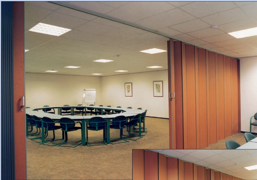
Kétszárnyú Mono fal, központi zárással