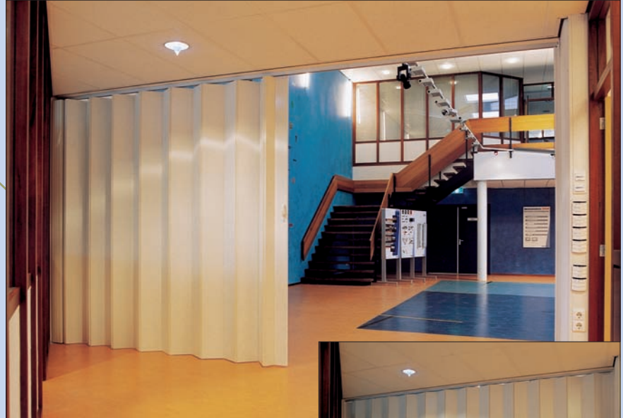
Egyszárnyú Mono fal, egyoldali zárással

A Parthos név időközben a szaktudás, a minőség és a megbízhatóság szimbóluma lett; termékeink megfelelnek az ISO-9001 minőségbiztosítási rendszer követelményeinek.